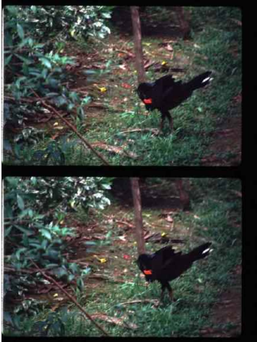
( Mitu tuberosa in the Peruvian Amazon)