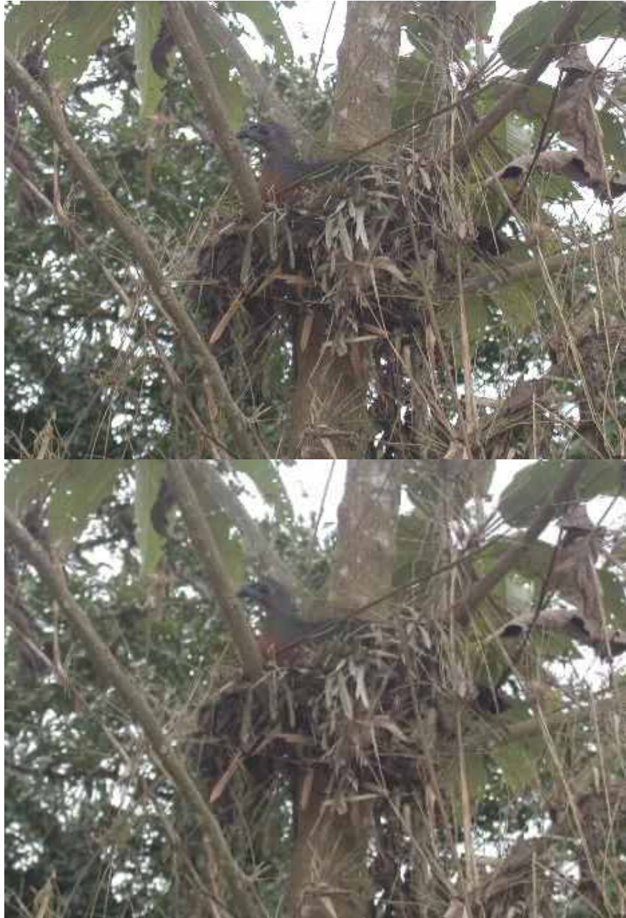
( Chamaepetes goudotii tschudii on nest)

Terborgh, J. and B. Winter. 1980. Some causes of extinction. Pp. 119-133 In: Conservation Biology: an Evolutionary-Ecological Perspective (M.E. Soule and B.A. Wilcox, Eds.). Sinauer and Assoc., Sunderland, Mass.