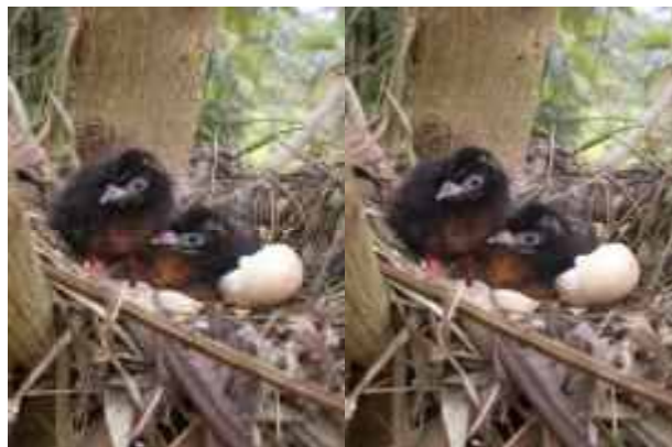
(Newly hatched C.g. tschudii chicks in nest; Photo by H.F. Greeney)

Sclater, P.L. and O. Salvin. 1879. On the birds collected by the late Mr. T.K. Salmon in the State of Antioquia, United States of Colombia. Proc. Zool. Soc. Lond. 1879: 486-550.